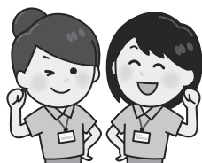
認知症地域支援推進員

また、家族や周囲の人からの相談を受け、認知症が疑われる人の家庭を訪問し、医療や介護サービス等に繋ぐお手伝いをします お気軽にご相談ください