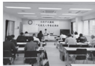
令和5年度水俣芦北圏域 市民後見人等養成講座

『市民後見人等養成講座』 では、権利擁護や成年後見 制度について学び、将来、 市民後見人や家族として後 見人になることを目指します